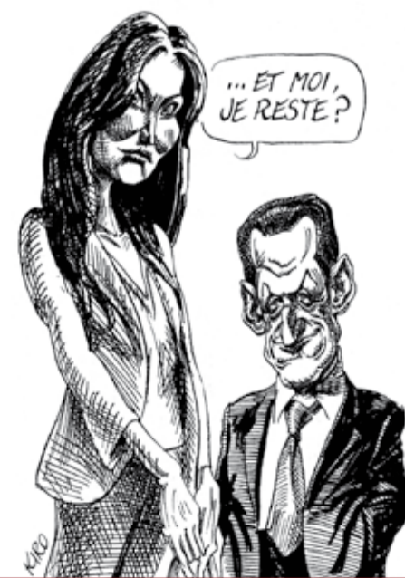
Vignetta di Kiro per “Le Canard enchaîné”

PANIQUE GÉNÉRALE AVANT LE REMANIEMENT DE NOVEMBRE