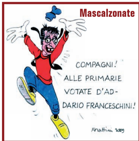
Vignetta di Forattini per Panorama

Ringrazio uno per uno i 7.046 elettori che alle elezioni del Parlamento Europeo hanno scritto il mio nome scegliendomi.