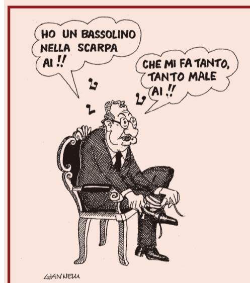
Vignetta di Giannelli per il Corriere della Sera

Naturalmente, il passaggio dei gazebo, pur importante per l'apertura alla base dei cittadini, rappresenta soltanto il primo momento di un percorso che si deve sostanziare nella preparazione di linee-guida e programmi nei quali il popolo dei moderati e dei cattolici democratici dovrà riconoscersi, oltre i richiami del leaderismo. Forza Italia, An, le varie altre realtà del mondo di centrodestra, sono attese a un impegno storico.