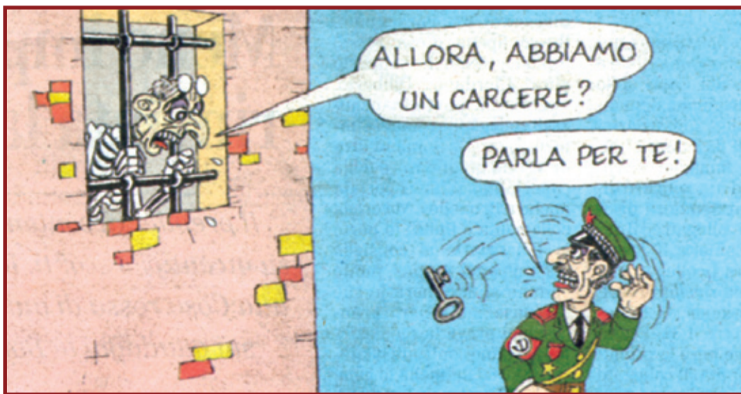
Vignetta di Giorgio Forattini per "Il Giornale"