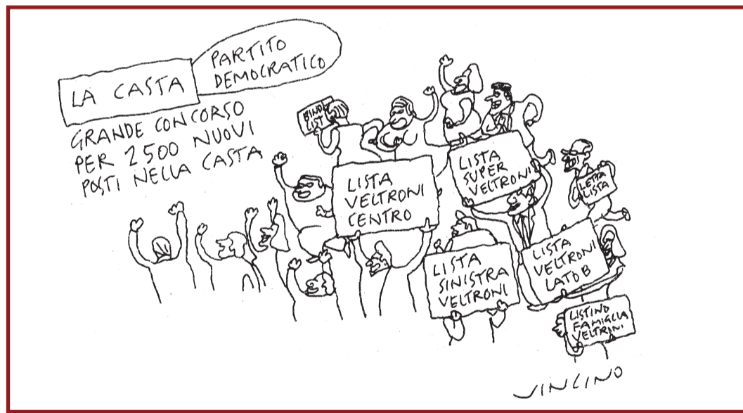
Vignetta di Vincino per "il Corriere della Sera"